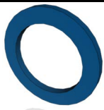
Tabela Dimensional Maßlistel Data chart Tabla Dimensional